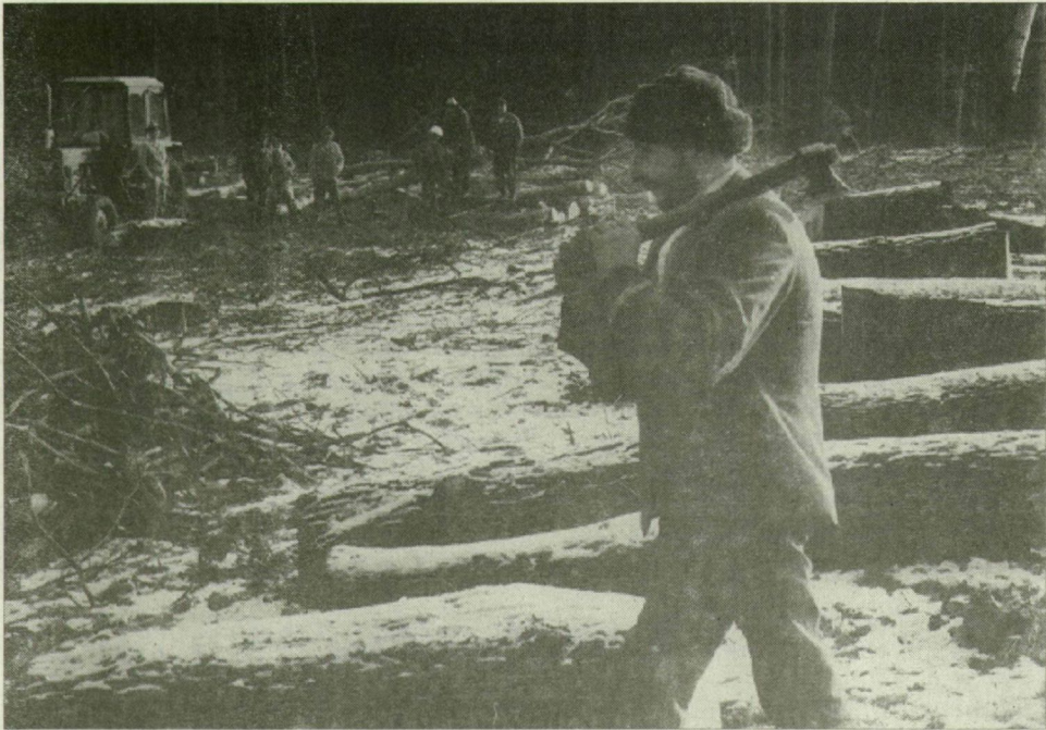
A fa csodálatos anyag. Időnként hiba csúszik a megmunkálásba

A fa csodálatos, sok mindenre használható anyag. Rönként, építőanyagként, bútorként, de gyufaszálként is szüksége lehet rá az embernek. A megmunkálásba, ha hiba csúszik, nincs veszélye semmi, másra még jó lehet. A peches, vagy épp a jó szerszám híjával küszködő mester kezében így válhat a gerendából fogpiszkáló. Onnan már nincs tovább.