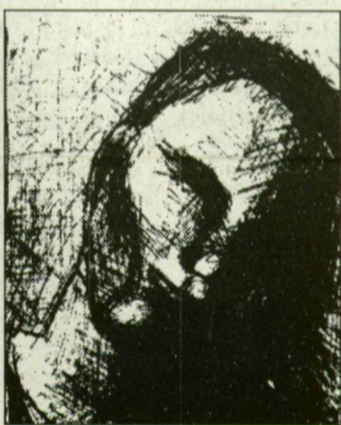
A fotó és a képek nem a nevelőotthonban készültek

egyáltalán nem barátságos. Edzésre indul, amikor megállítom.