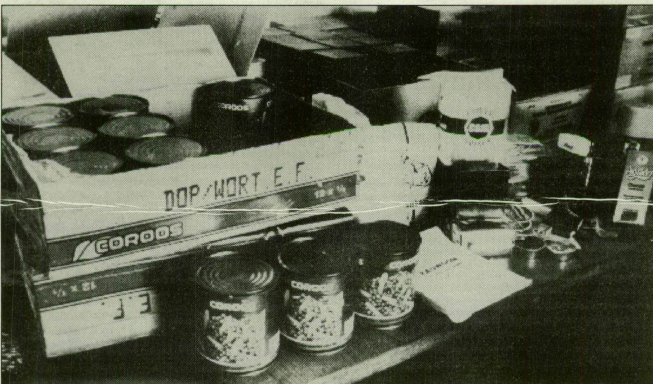
A felvételek nem a riport helyszínén készültek

S tegyük hozzá: a lakosság megértésére, segítségére az eddigieknél is nagyobb szükség van. Sajnos, nem alaptalan a kérés: senki ne éljen vissza az otthonukat elhagyni kényszerülő magyarok kiszolgáltatottságával.