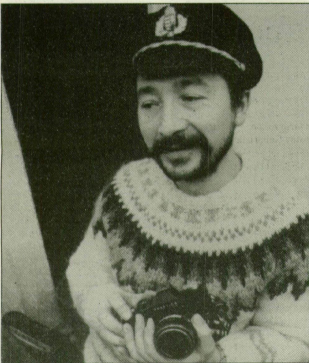
FOTÓ: NAGY LÁSZLÓ

A közép-kelet-európai együttműködésnek keretet adó szervezetben, amely bizonyos programjainak megvalósításához már a londoni Kelet-Európa banktól is kapott hiteleket, kiszivárgott értesülések szerint Ausztria képviselői vehetik át az elnökséget Jugoszláviától, amelynek további részvétele az eddigi formák között kétséges.