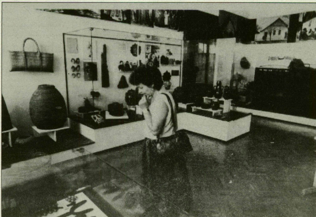
A múzeumi hattyúdál: Szeged népművészete – állandó kiállítás

– Kívánom, legyen úgy, mint szeretné, s amint eltervezte a tanszék és saját további tevékenységét!