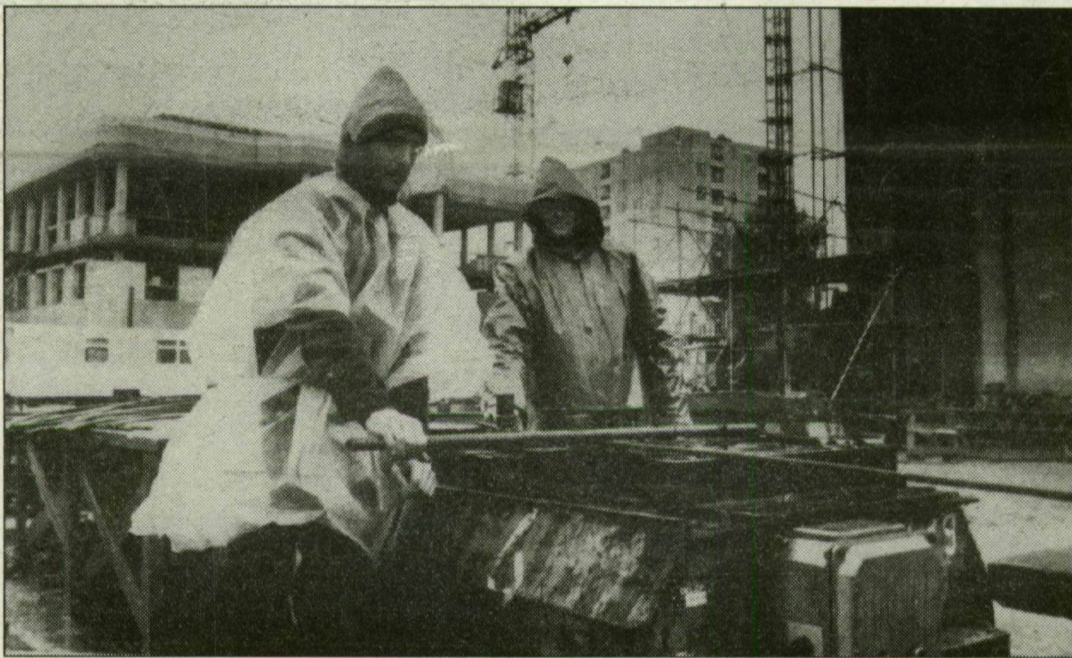
A Kitaró hétvégi esőzés ellenére is kitartottak a Délépszer Kft. toronyépítői