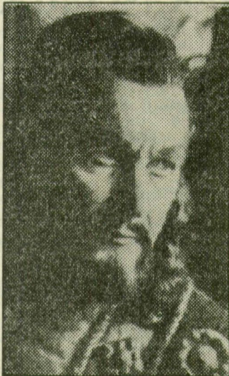
Bánk bán és Otello szerepében

– Nehéz lenne ezt széjjelboncolgatni. Ő egy nagyszerű betanított mester volt. Ő szokatott például a fegyelmelmeztségre, a muzsikálásra, a dallamok megformálására, az értelmes éneklésre. Hogy ne csak kikiabált hangok legyenek, hanem mindig zene legyen. Akkor még volt ideje arra, hogy ezeket magyarázza nekünk. Mindig úgy ment a próba, hogy az egész társaság ott volt minden próbán. Az is, aki épp nem énekelte. Amit nekem mondott, az tanulság volt a többieknek is. Fantasztikus