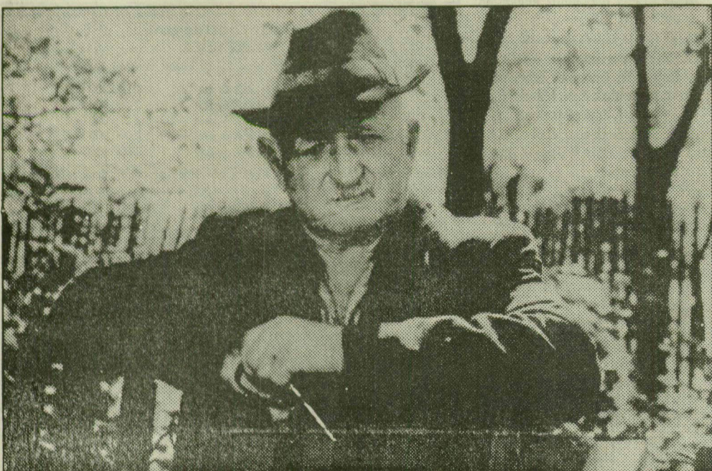
Hátul és szemben