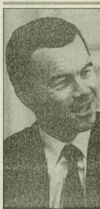
Magyarországnak nem segegyre van szüksége, hanem együttműködésre – mondta Szegeden a francia nagykövet

– Pontosan így, mivel ebben a fejlődési szakaszban Magyarország valójában együttműködő