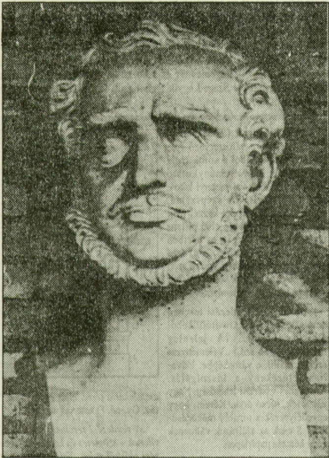
Markó Béla Széchenyi portréja a Panteonban (1930)

„A kincstár azonban több mint egymilliót veszítene. Csak hogy túl sok féreg rácsdál az izletes millió, sem hogy a bajt gyökerestül ki lehetne irtani. Egyébként vannak országok, melyek csak visszaélésekből élhetnek, – mint ahogy olyan emberek is, akik mindennapi életüket orvossággal tengetik – és anélkül bekövetkezik a halál.”