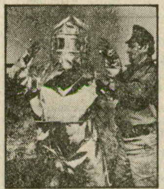
Öltöztetik a tűzgyújtót