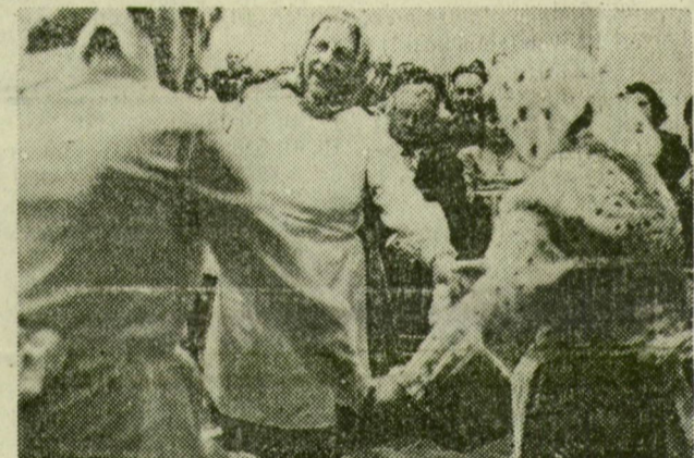
Tápei asszonyok tánca