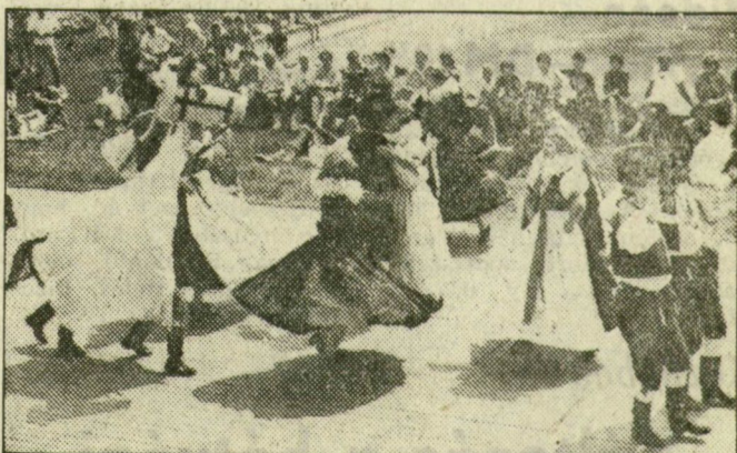
Népszokás — Csehszlovákiából