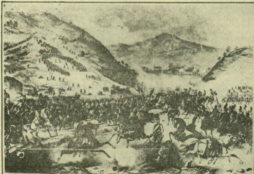
A magyar sereg Pákozdnál szeptember 29-én visszaveri a támadó Jellasicsot.