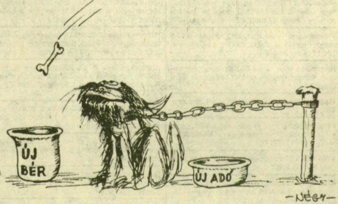
A semminél — több...

A környezetvédelmi feltárás ez év december 15-én és 16-án 240, kétszázliteres oldószer-hulladékkal töltött elásott hordót hozott felszínre a vegyipari és hulladékhasznosító ágazat telephelyén. A feltáró munkát tovább folytatják, s így várható, hogy a közeljövőben a föld alatt lévő veszélyes hulladékok egészét a felszínre hozhatják.