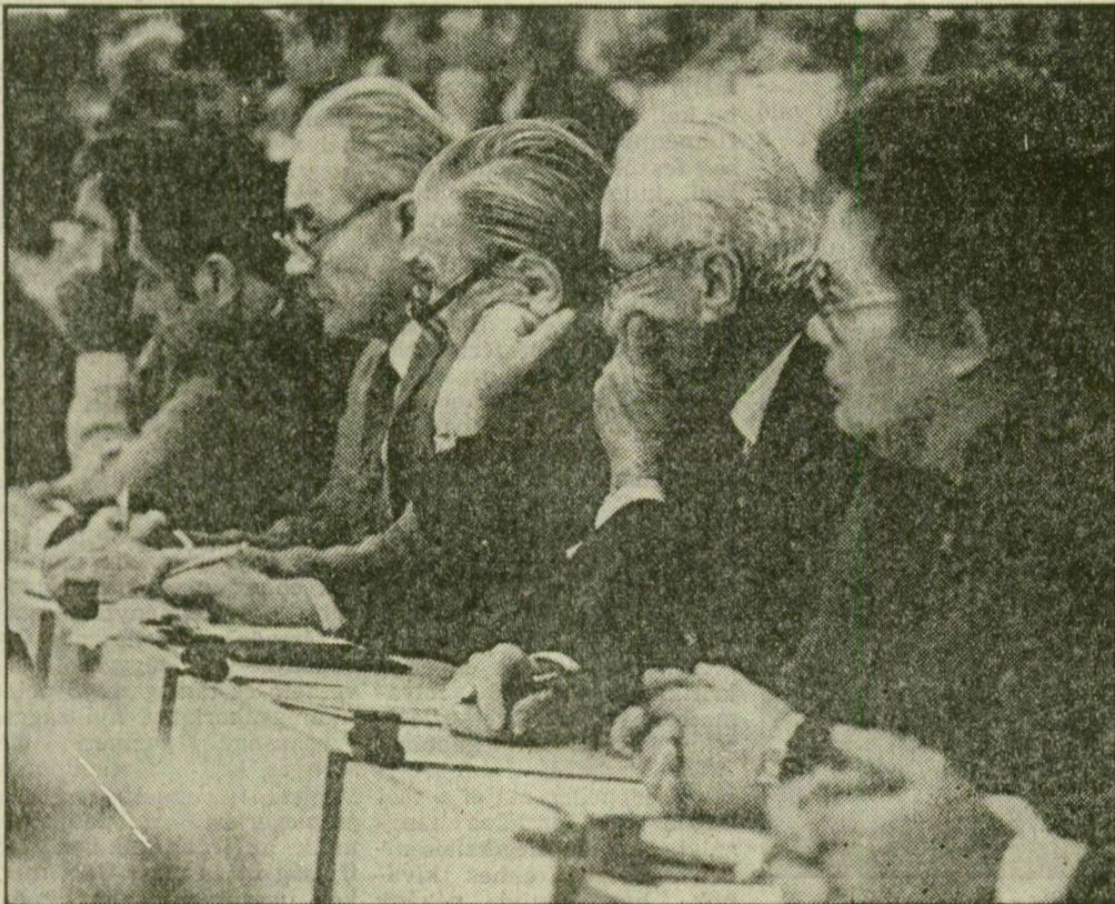
Pillanatkép — munka közben

Fel szólalásában a Tisza Volán kommunistái nevében a „hogyan tovább?” kérdését vetette föl. Utalt arra, hogy a gazdaság jelenlegi gyöngye teljesítményéből való kilábaláshoz olyan módszerek és eljárások látszanak alkalmasnak, amelyek sok szempontból lényegükben térnek el a meglévő és kialakult gyakorlattól (szocialista piacgazdaság, vegyes tulajdonviszonyok, önálló kifizervezetek stb.). Ezek az új fejlemények szükségessé teszik a munkahelyi pártszervezés merev szerkezetének átgondolását, rugalmasabbá tételét. A jövőben mindezt tekintettel új típusú emberekre és politikai módszerekre lesz szükség. Javasolta, hogy az újonnan választott pártbizottság e kérdéseket a következő pártértekezletig tekintse át. Szólt arról a gondról, amit az okozhat, hogy a munkahelyi pártszervezetek, amikor támogatják az ésszerű gazdálkodást, szembekerülhetnek egyéni és csoportérdekekkel. Ahogyan mondotta: kemény szelekciónélkül nincs kibontakozás, de az ezzel együttjáró feszültségek kezelését meg kell ta