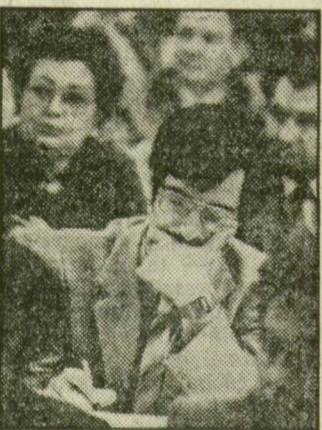
Egy arc az ülésteremből

ralizmus megteremtésének szándékát jóhiszeműen, bizalommal táplálja — a kezdeményező pozíciójából. Együttműködési készségünk nem a gyöngeség jele, hanem minden alkotó gondolat megbecsülésének igazolása. És annak felismerése: történelmi szakaszváltásban vagyunk, amikor a továbblépés pluralizmusa — szocialista jövőnk megalapozásának záloga lehet. Eppen ezért a társadalmi önszerveződésben Szegeden is megalkult, illetőleg születő egyesületekhez, klubokhoz, mozgalmakhoz partneri magatartást ajánlunk. Mér-