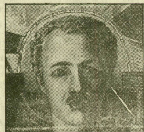
BURLJUK: KAMENSKIJ PORTRÉJA

Az ezüstenyő talpig súlyos fényben. Virágmáglyák a völgyben, dombokon. Arany napszirmok villognak a szélben. Az ég megárad. Kék örvény sodor. A ragyogás már gyűjtogatni készül, a dél homlokán ver, dobol a láz. Lángtükrű folyók forrnak, sisteregnek. Nézd, a halál is pipacskoronás.