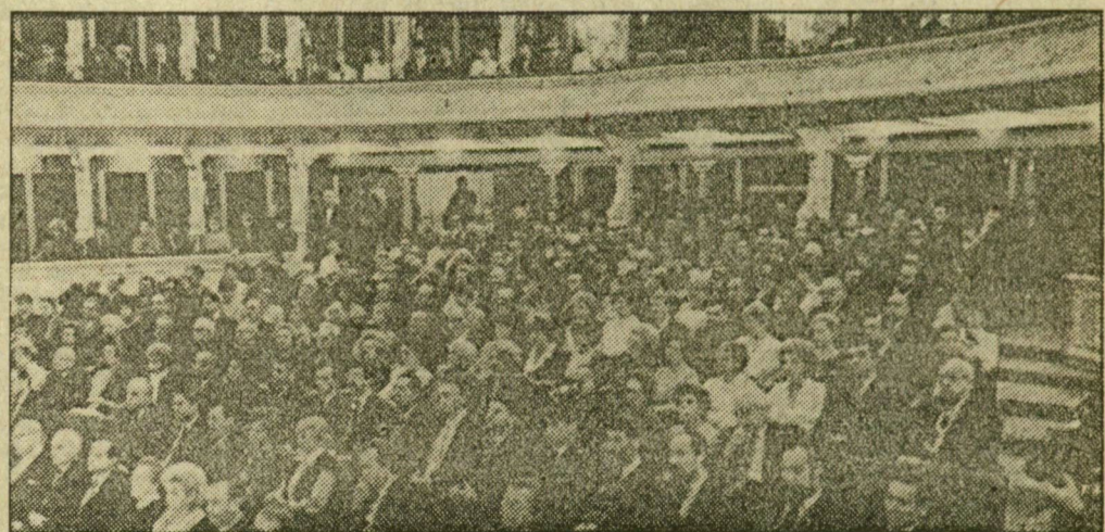
Az egyetemi ünnepség résztvevőinek egy csoportja