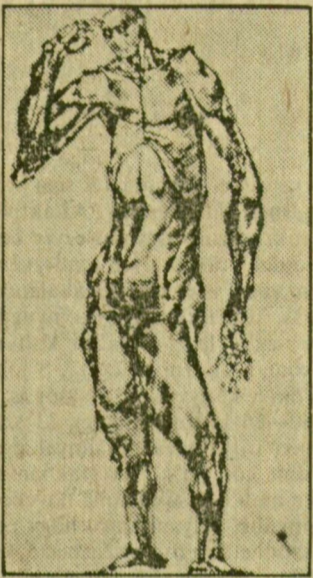
Erdélyi Attila rajza