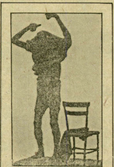
T. SCHJENTE: ÖREGEDŐ BOHÓC