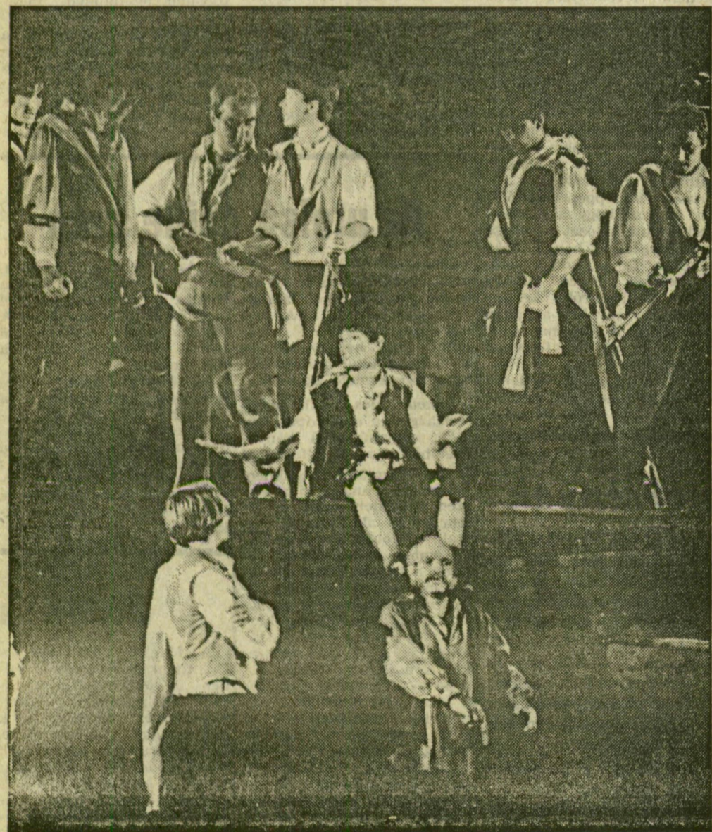
A forradalmárok között a kis Gavroche — és Javert felügyelő...