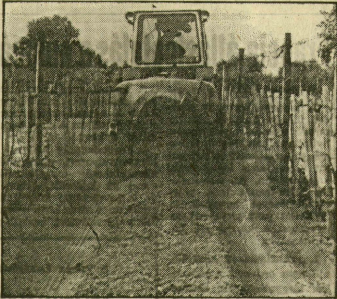
A szőlők növényvédelmét egy pillanatra sem hanyagolják el Forráskúton

Ritka időszak az, amikor a mezőgazdaságban a jó terméshez minden feltétel egyszerre adott. Most, oly sok aszályos hónap után végre nem panaszkodhatunk a csapadékra. Mégsem felhőtlen a termelők kedélyállapota. A palántázott, melegigényes növények — a paprika, a paradicsom, a dinnye — a hűvös idő miatt nehezen ternek magukhoz. Ilyenkor a gombabetegség ellen is fokozottan kell védekezni kertészetben, szőlőben, gyümölcsösben egyaránt. A kukorica színe nehezen vált haragoszöldre, fakó, sárgás színű növényekből úton-útfélen sokat láthatunk. A gazzal annál inkább meg kell küzdeni, ahol a gyomirtózás nem elterjedt, így a kisgazdaságokban is kerti traktorral, lovas ekével, kiskapával irtják a kéretlenül kelt növényeket, s egyúttal lazítják is a talajt.