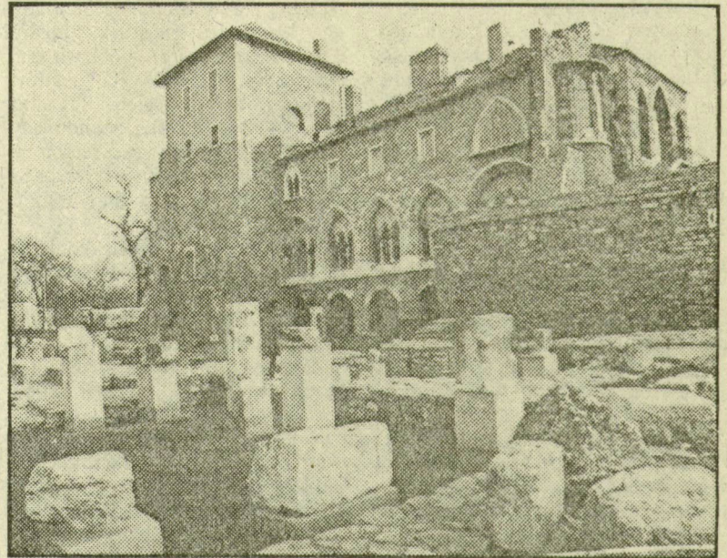
A tatai vár

Esztergom 250 éven át tartó felfelé ívelését aztán egyik napról a másikra törte derékba a tatár, amikor 1241/42 telén elfoglalta a várost, és lakóit utolsó szálig leölte. Ez is hoz-