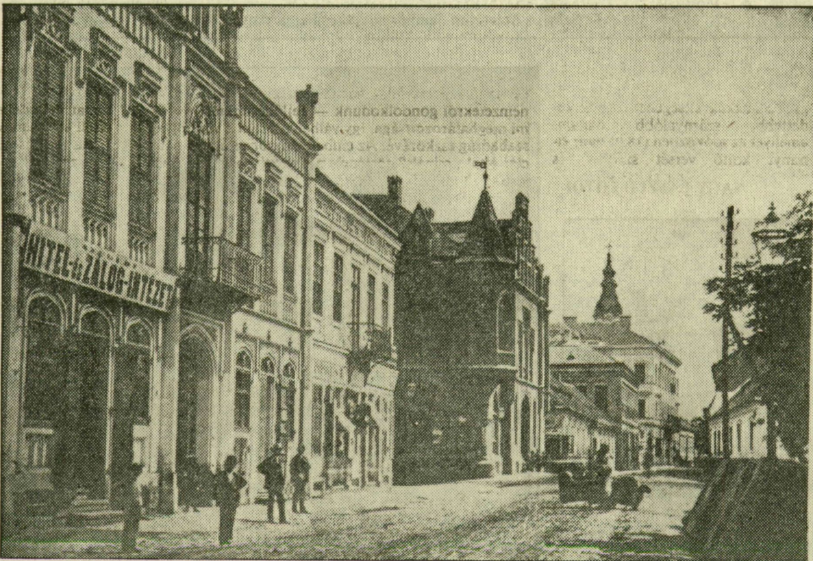
Az 1872-es fotó szerint ilyen volt a Kereszt utca...