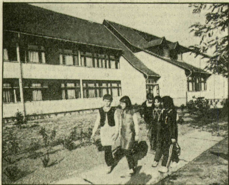
Szép lett az új sándorfalvi iskola

Fontos feladatnak tekintik a lakóházak komfortfokozatának növelését, mindkét községben a vízátviteli kapacitásbővítést. Gondot fordítanak a környezetvédelemre, a szennyvízhálózat kiépítésére; a kereskedelmi ellátás korszerűsítésére, szilárd burkolatú út és járda létesítésére. Épül majd óvoda, célcsoportos lakás, gázvezeték és csapadékvíz elvezető csatorna is. Több telket alakítanak ki. A községek fejlesztéséhez szükséges a lakosság anyagi segítsége, társadalmi munkája is.