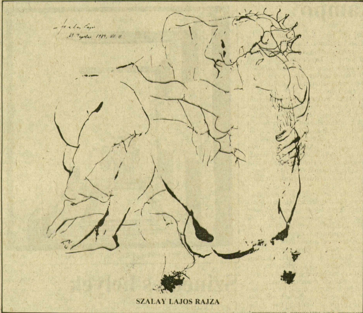
SZALAY LAJOS RAJZA