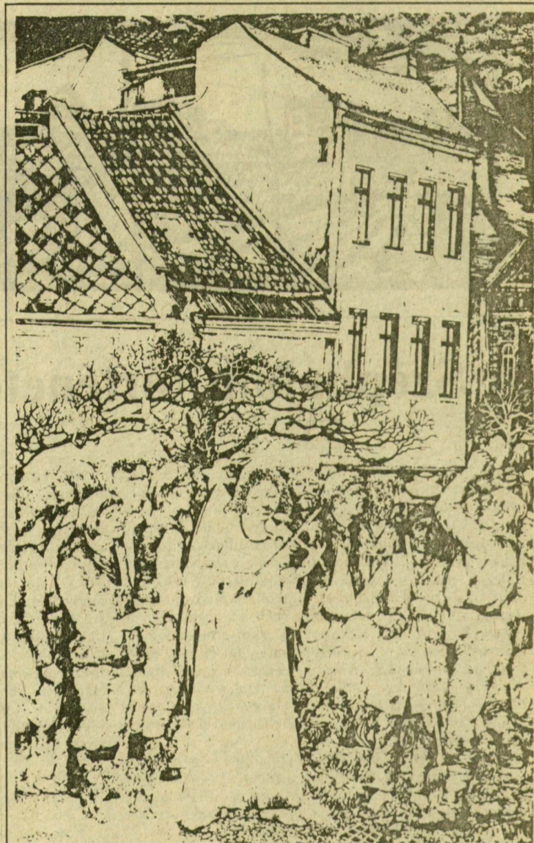
RÉVÉSZ NAPSUGÁR: ANGYAL SZÁLLT LE...