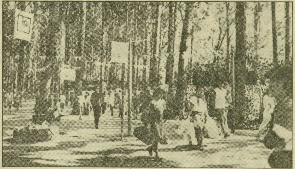
Erkezők, fák, nézelődők — Mártélyon

Több nappal a találkozó előtt, a főszezon vége felé az üdülők, a falu apraja-nagyja a megszokottnál nagyobb sürgést-forgást figyelhetett meg. A régi parti kemping és környéke egy haditornára készülő katonai alakulat munkálatait idézte. A sudármas nyárfák közé hatalmas katonai sátrak kerültek. Az alcahalókkal utcák, utak nyitlak. Erősítők, aggregátorok, több tonnás gepkocsiak zaja verte fel a csönidet. A jurtakempingnél, a strand előtti téren színpadot ácsoltak szorgos kezek. A helyi és a környékbeli vendéglátósok erősítették állásait. Az éles töltenyek: sörös-, boros-, üdítősuvegek 10 ezrei érkeztek.