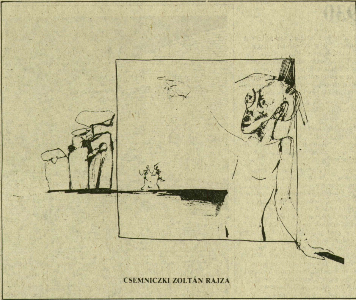
CSEMNICZKI ZOLTÁN RAJZA