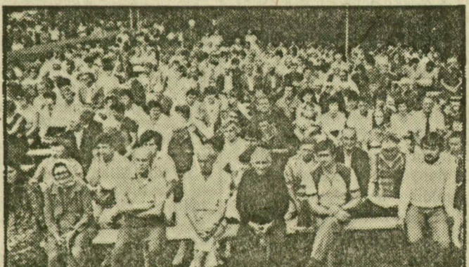
A nagygyűlés szónokát hallgatták