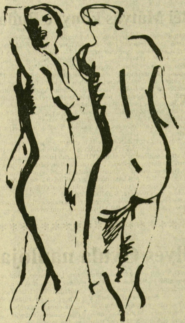
NOVÁK ANDRÁS RAJZA