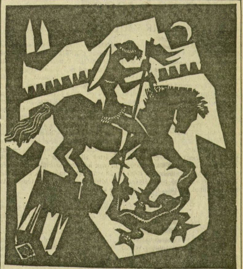
KOPASZ MÁRTA METSZETE