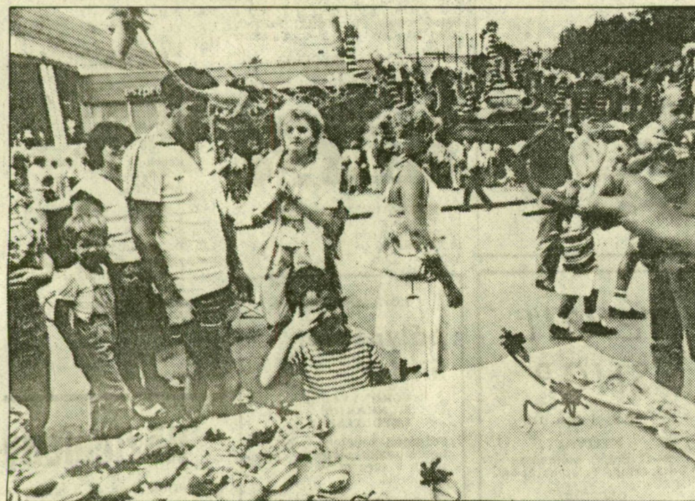
A népművészeti vásár sikere vitathatatlan