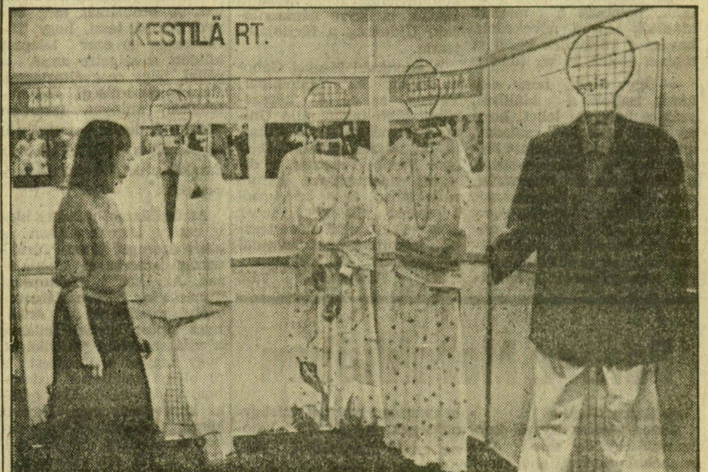
Részlet a finn kiállítók pavilonjából

A felmérések szerint jelenleg hét megye 574 települése elmaradt, s ezeken mintegy félmillióan élnek. Több mint négyszáz településen semmiféle ipari tevékenység nincs, s a terület 160 mezőgazdasági nagyüzeme rendkívül gyenge adottságú. E helységeken hosszú távon csak úgy lehet megtartani a népességet, csökkenteni az elvándorlást és az ingázók számát, ha az ipar és a mezőgazdaság összefogásával konkrét terveket dolgoznak ki az iparfejlesztésre.