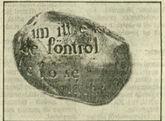
LAPIS ANDRÁS MUNKÁJA