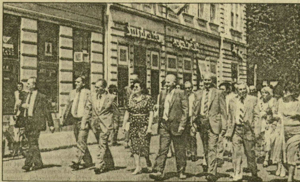
Séta Szeged Belvárosában

vezetők társaságában végig sétáltak a Széchenyi téren, a Kárász utcán. Egy pillanatra megállt a forgalom, a szegediek érdeklődve figyeltek a nem mindennapi eseményt, ami páratlan szűkebb pártiak történetében, hiszen először fordult elő, hogy a diplomaták testülete a megyében járt. A nagykövetelek megtekintették a kirkatokat, megismerkedtek a város nevezetességeivel, bemutatták a Szeged Nagyaruházba, ahol arra voltak kíváncsiak, hogy milyen egy