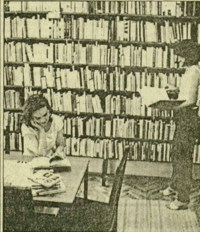
Tömött könyvespolcok, kellemes, nyugodt olvasóhelyek várják a látogatókat

A hely: Vértói út 5. számú ház, „fogadószint”. Az időpont: ma, hétfő délelőtt 10 óra. A lényeg: megnyitja kapuit a Somogyi Könyvtár legújabb részlege, úgy is, mint az új rókusai városrész lakóinak szolgáló, ott pillanatnyilag egyedülálló közművelődési intézmény. Ünnepséggel nem lesz, érdeklődő tömeg viszont minden bizonnyal, hiszen már a berendezkedés elmúlt heteiben, napjaiban számosan kérdezősködtek a könyvtár hiánnyal, infrastrukturális ellátatlansággal küszködő új városrészekre. S folytatódhatott a sor, Odessza, Tárján, Makkosház városrészek után Rókuson is hely került a könyveknek. Összesen 17 ezer kötet várja a környék lakóit, külön terem a gyerekeknek, hiszen — mint minden új lakótelepen —ők az igazán rendszeres könyvtárlátogatók. Idővel zenei szolgáltatásokra is képes lesz az új könyvtár, a hallgatóhelyeket most szerelik. A lemezhallgatás mellett nyelvtanulásra is módot nyújt majd — a zeneszoba.