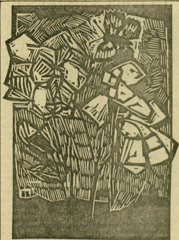
BAKACSI LAJOS METSZETE