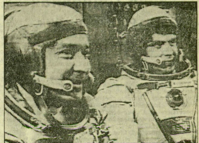
A Szozuz T-15 szovjet űrhajó legénysége, Leonyid Kizim (balra) és Vlagyimir Szolovjov.

A Szozuz T-15 legénységének mindkét tagja tapasztalt űrhajós