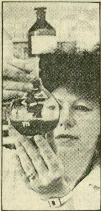
Bizalmat keltett a külföldi vevőben is

Évekkel ezelőtt az állat-egészségügyi és élelmiszeripari vizsgálatokat összevonták. A Bécsi körúton az élelmiszer-ellenőrző osztály dolgozik.