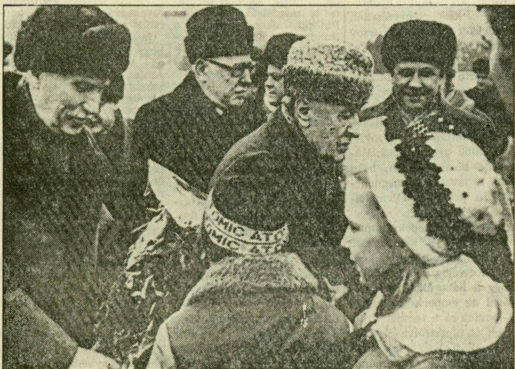
Kádár Jánost és Lázár Györgyöt a moszkvai repülőtérén virággal köszöntik. Szemben (balról jobbra): V. Csebrikov és B. Scserbina