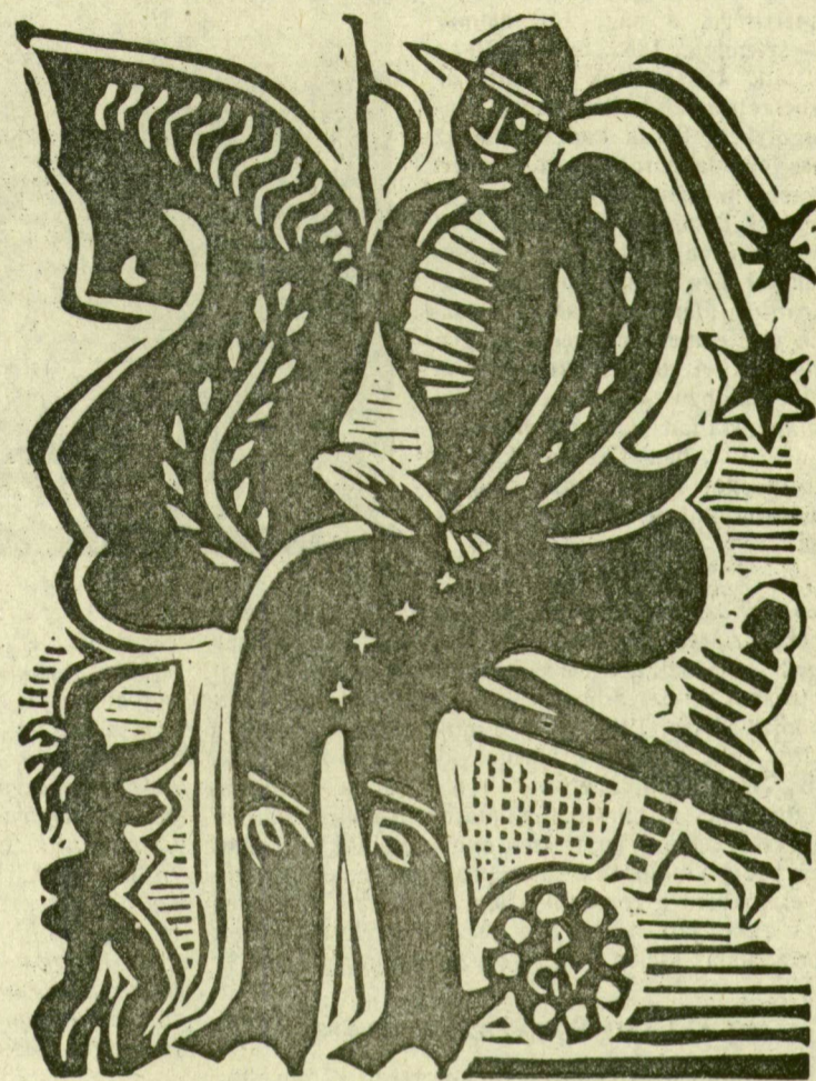
PAPP GYÖRGY: NÁDPARIPÁN