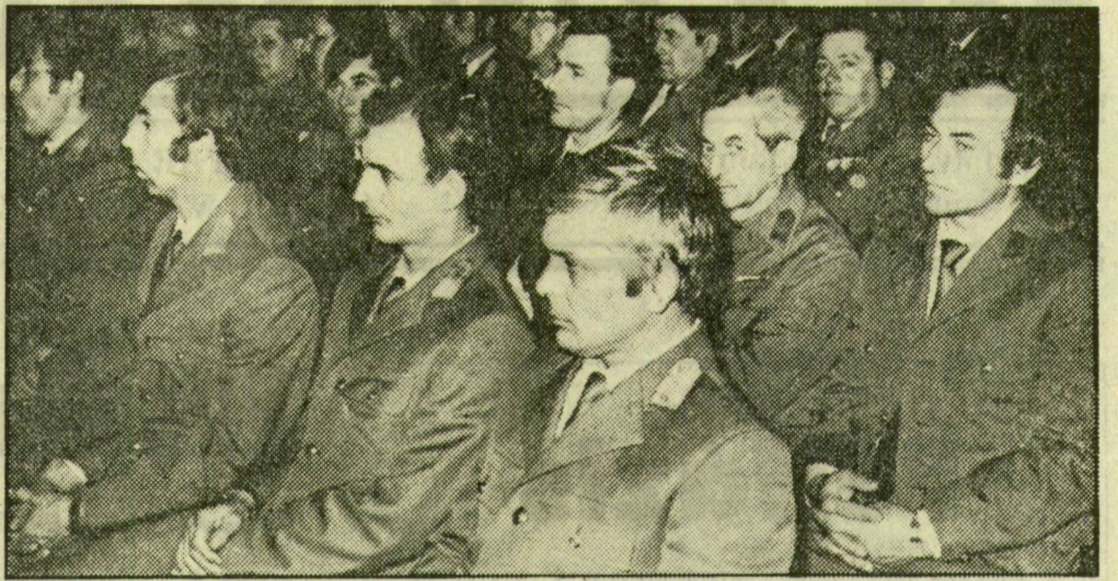
A munkásőr-egységgyűlés résztvevőinek egy csoportja

(Folytatás az 1. oldalról.) Sándor átadta az egység megbízott parancsnokának a Hazafias Népfront Országos Tanácsának kitüntetését, a „Kiváló Társadalmi Munkáért” oklevelet és emléklapok. A magas elismerés indoka pedig: az egység munkásőrei megyénk 23 településén aktív részt vállalnak a környezet alakításában, a községek fejlesztésében, s társadalmi munkájukkal maradandó értékeket teremtenek.