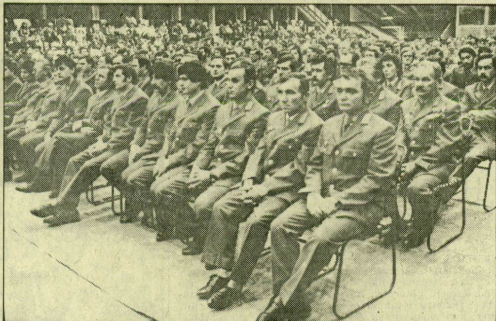
Munkásörök az úszegedi Sportcsarnok széksoraiban

Vasárnap Varsóban veget ért az értelmiségiek világkongresszusa. A négynapos tanácskozás résztvevői sikrászálltak amellett, hogy még ebben az évszázadban számolják fel az atomfegyvert, s felhívást tettek közzé, amelyben sürgették a leszerelést a fegyverzetek valamennyi területén.