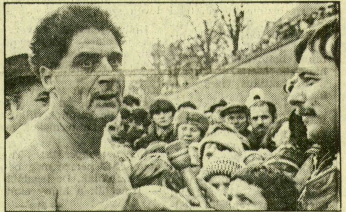
Nyilatkozat a televízióknak