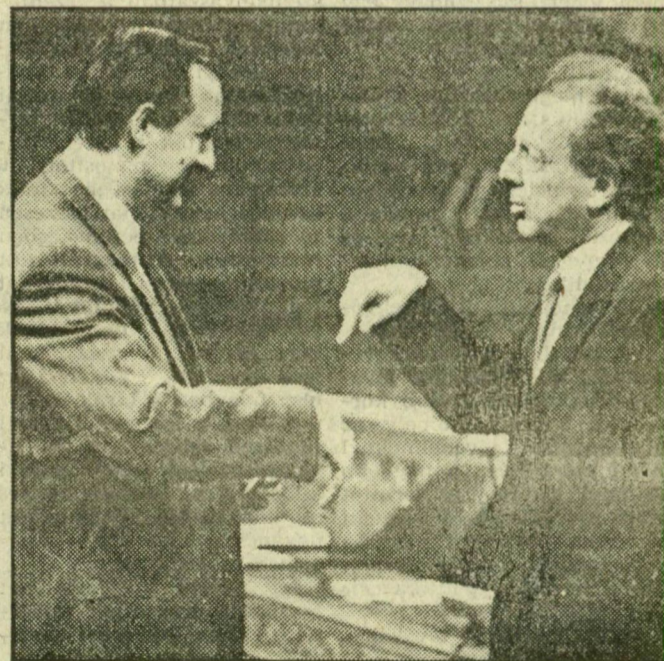
Nagy László képriportja