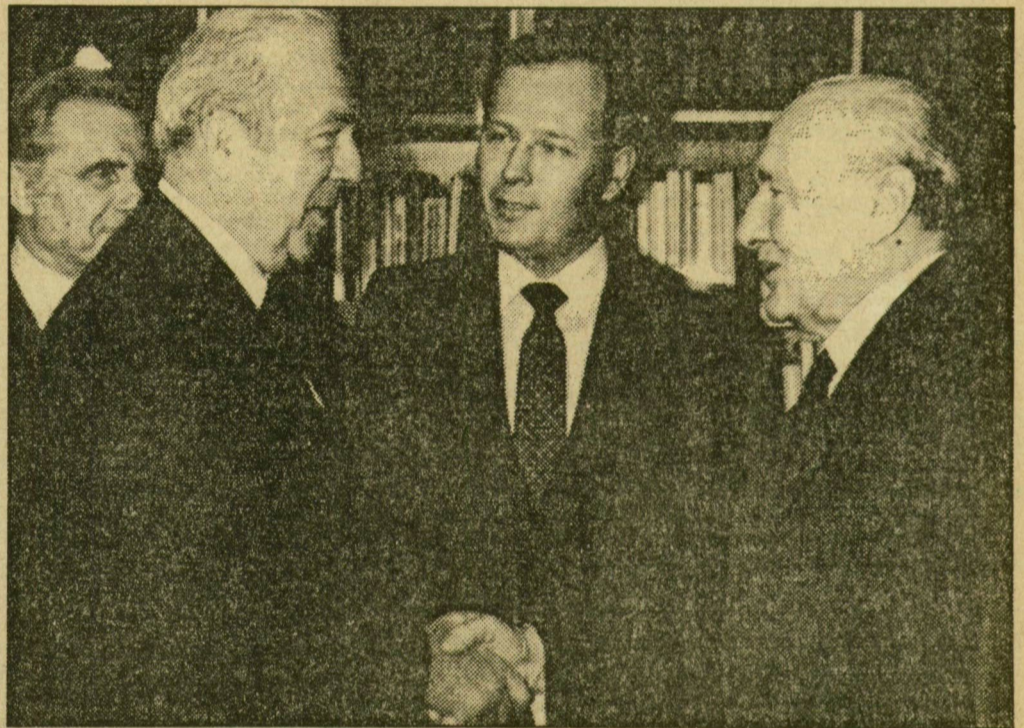
Shultz amerikai külügyminisztert fogadta Kádár János, az MSZMP főtájtára

George Shultz tárgyalásai — Sajtótájékoztató