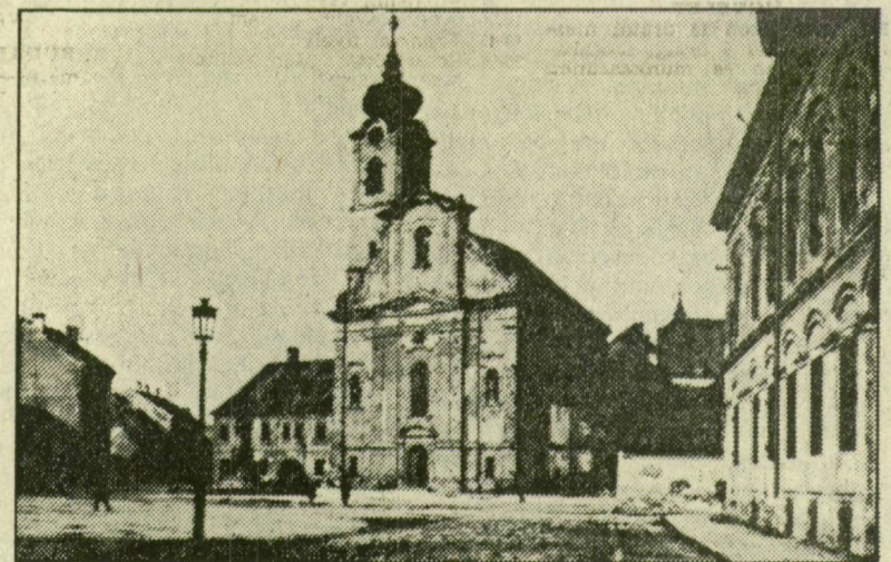
AHOVÁ A FOGADALMI TEMPLOM ÉPÜLT