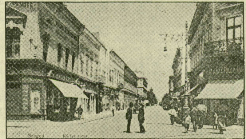
A KÁRASZ UTCA A SZÁZAD ELEJÉN