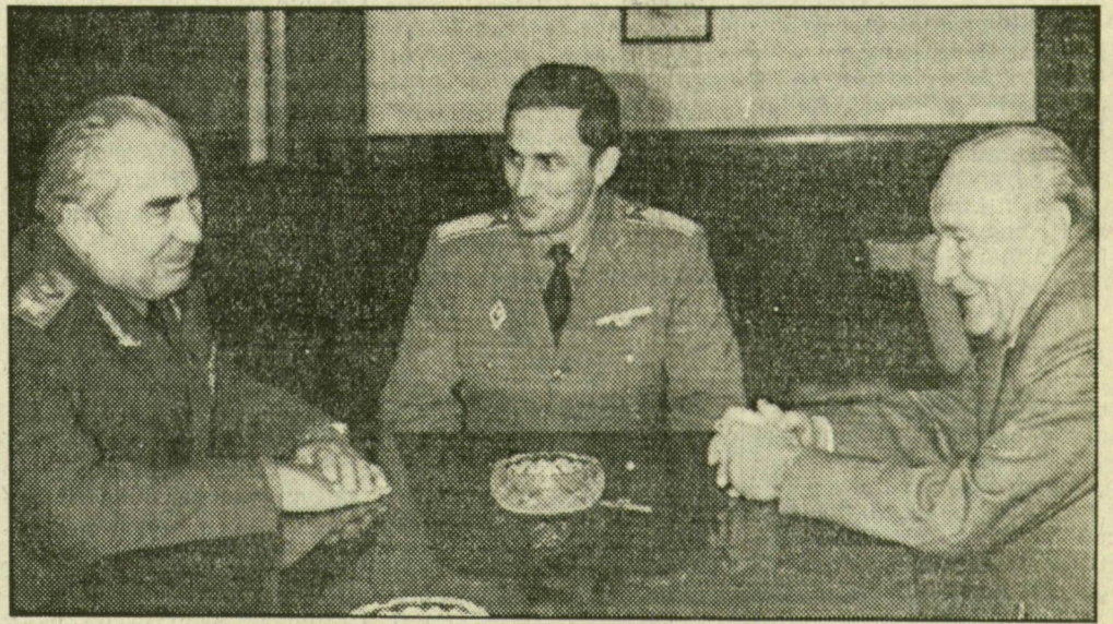
Kádár János megbeszélése Viktor Kulikov marsallal, a Varsói Szerződés Egyesített Fegyveres Erőinek főparancsnokával.

Kádár János, a Magyar Szocialista Munkáspárt főtitkára szerdán délután, a Központi Bizottság székházában fogadta Viktor Kulikovot, a Szovjetunió marsallját, a Varsói Szerződés Tagállamai Egyesített Fegyveres Erőinek főparancsnokát.