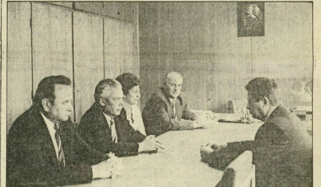
Megbeszélés a megyei pártbizottságon